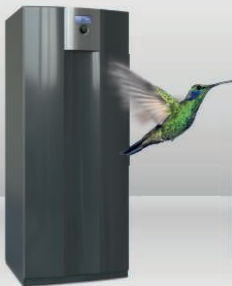
Seeria SWC 4-19 kw | on/off | 2-16 kw | inverter |