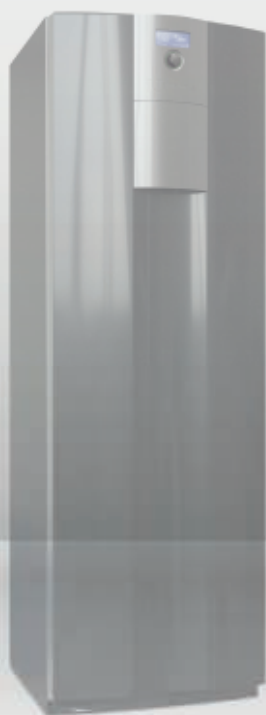
Seeria WZS 4 -12 kw | on/off | 2 -13 kw | inverter |