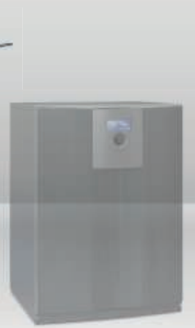
Seeria SW 4-19 kw